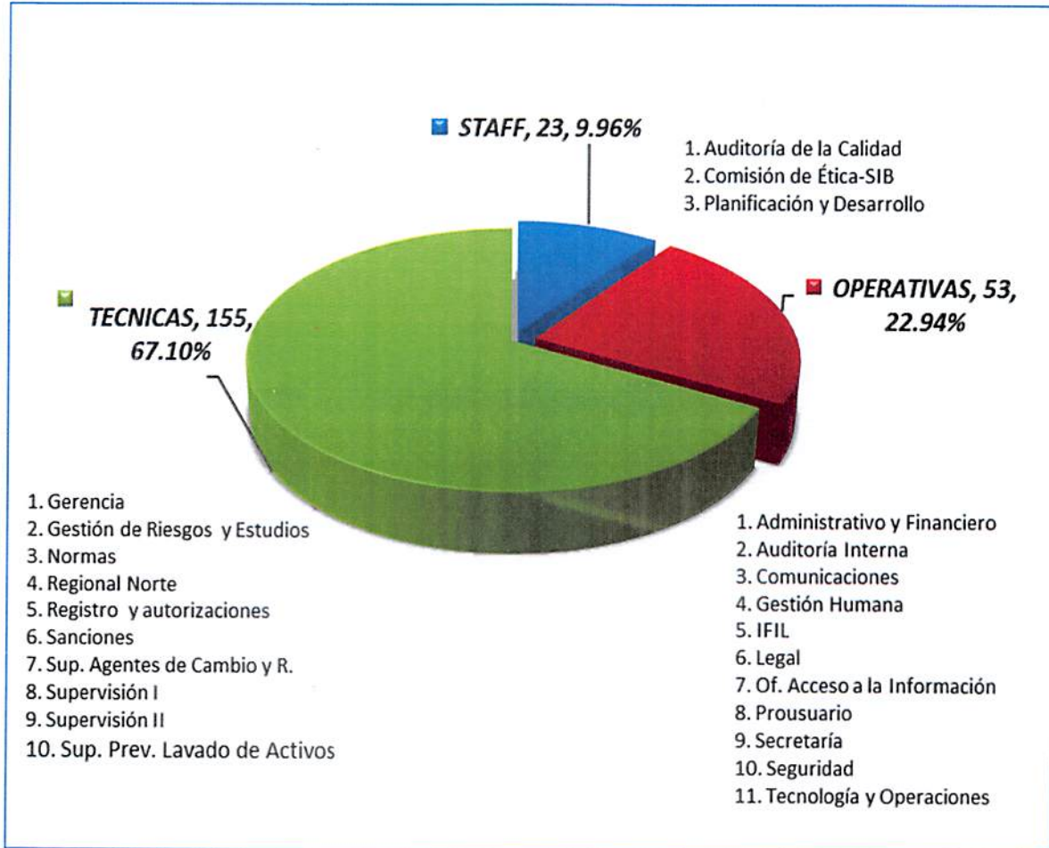
Gráfico No. 3: DISTRIBUCION DE PROYECTOS POR AREA FUNCIONAL DE LA SIB